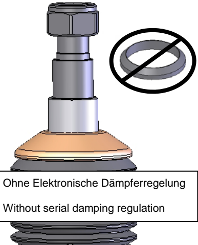
Ohne Elektronische Dämpferregelung Without serial damping regulation

Original Stützlager aufstecken und mit der mitgelieferten Stopmutter verschrauben. Das Anzugsdrehmoment der Kolbenstangenbefestigung beträgt 50 Nm. Die Montagehinweise zum Einbau des Federbeines in das Fahrzeug, sowie die Anzugsdrehmomente der Federbeinbefestigung, entnehmen Sie bitte den Unterlagen des Fahrzeugherstellers.